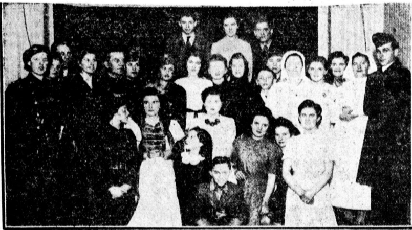
A MANSz Fütőnek csoportja jó tekonycélu előadásának szereplői

— Gazdák figyelmébe. Felhívjuk azon gazdák figyelmét, akik cukorrépa termesztéssel foglalkoznak, hogy előnyös feltételek mellett köthetnek egyesületünkkel cukorrépa-termelésre szerződést. A m. kir. Egyedárusági szeszgyár, Szalmárnémeti, a következő feltételek mellett köt szerződést: Kat. holdanként 16 kg répa-magot ad előre. Beváltási ár: A termékek és beváltók által közösen megállapítandó ár, amely kb 4 és 5 pengő között változik. Készpénz előleg kat. holdanként 12.— pengő. Szeletjárándóság: 60 százalékos ingyen. Cukorjórándóság: kat. holdanként kb 10 kg cukornagykereskedő árban. Műtrágya: a szeszgyár által előlegezve. Debreceni Gazdasági Főosztály.