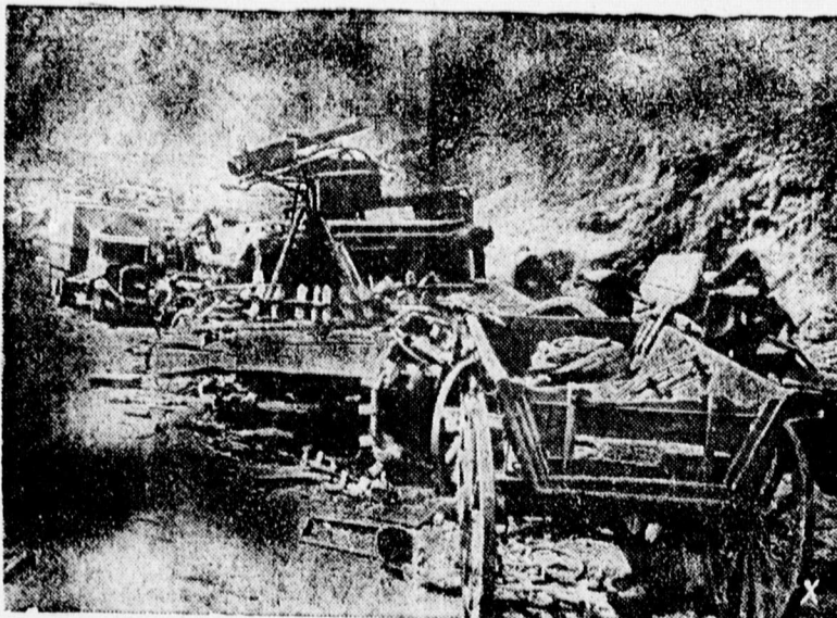
A szovjet hadsereg visszavonulási útja a keresi esata után