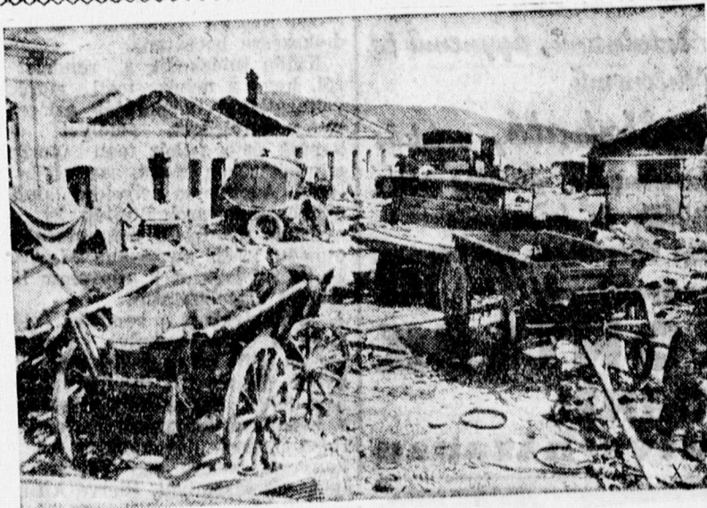
Egy útközvet után a keleti harctéren

Athén, június 27. A szaloniki rendőrség nagy rablóbandát tartóztatott le, amelynek tagjai kizárólag zsidók, köztük több jólismert zsidó nagykereskedő és szállítási vállalkozó, akiknek a városban nagy ingatlanok és üzleteik vannak. A banda már tíz hónapja működött és 37 betörést követett el, amelynek során ötvenmillió drachma értékű árut rabolt össze.