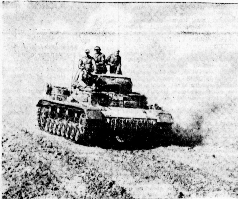
Előnyomulás a sivatagban.