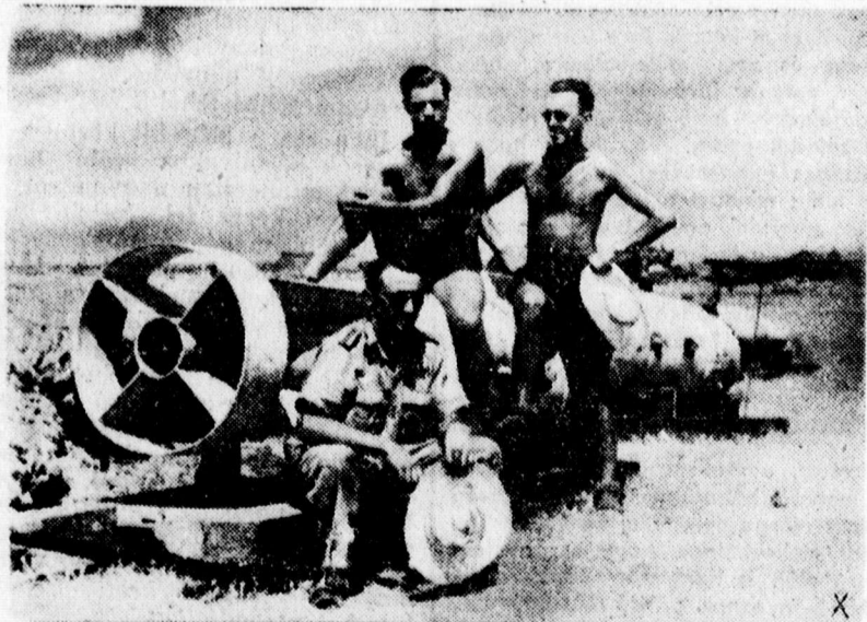
Egy német tábortéri repülőterén

— Tegyük el télire zöldfőzeléket. A m. kir. Közellátási Hivatal a „Táplálkozásunk helyesen” című kiadmánysorozatában most egy újabb füzetet adott ki amely a zöldség és főzelékfélék téli eltevésével foglalkozik. A kiadvány ismereti a zöldség és főzelékfélék téli tárolásának célját és jelentőségét, majd 30 különféle zöldség téli tárolásának módjait írja le. Külön fejezetet szentel a zöldség és főzelékfélék szárításának és aszálásának. Megemlékezik a savanyítással, sózással, gőzöléssel és ecettel való eltevési módokról közel 100 recept alapján. Hasznos útmutatást ad a főzőedények és a tartósításra szánt üvegek helyes tisztítására és kezelésére. A füzet 20 filléres áron kapható az egyes közellátási felügyelőségeknek.