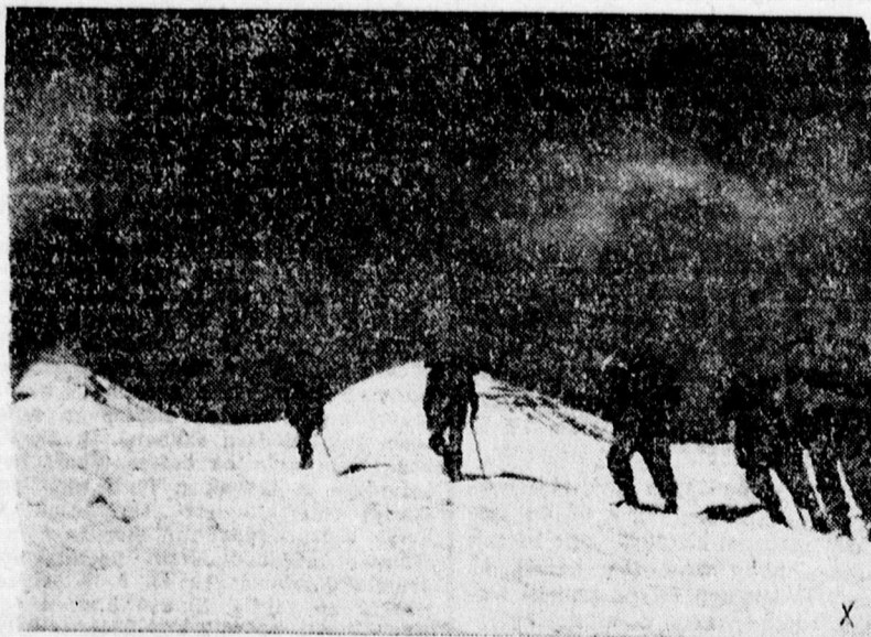
Német hegyivadászok a Kaukázus legmagasabb csúcsán, az Elbruson.