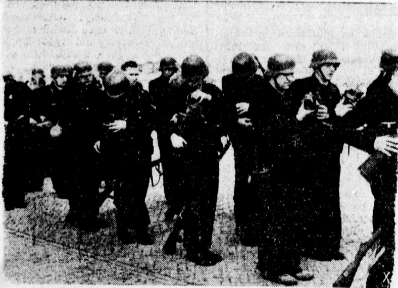
Szarazföldi partvédelemre kiképzett német tengerész csapa.