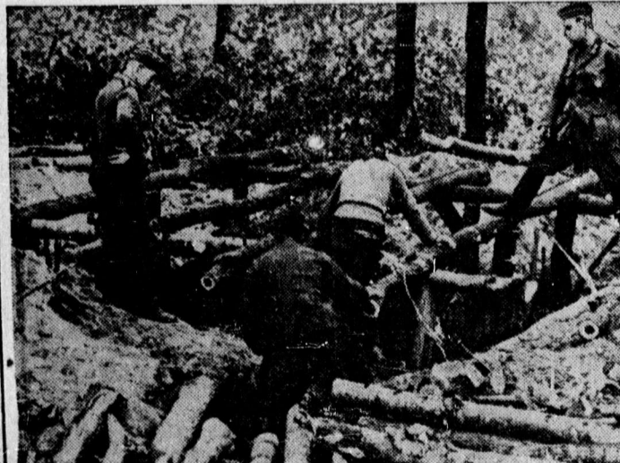
Fedezék készítés a keleti fronton.