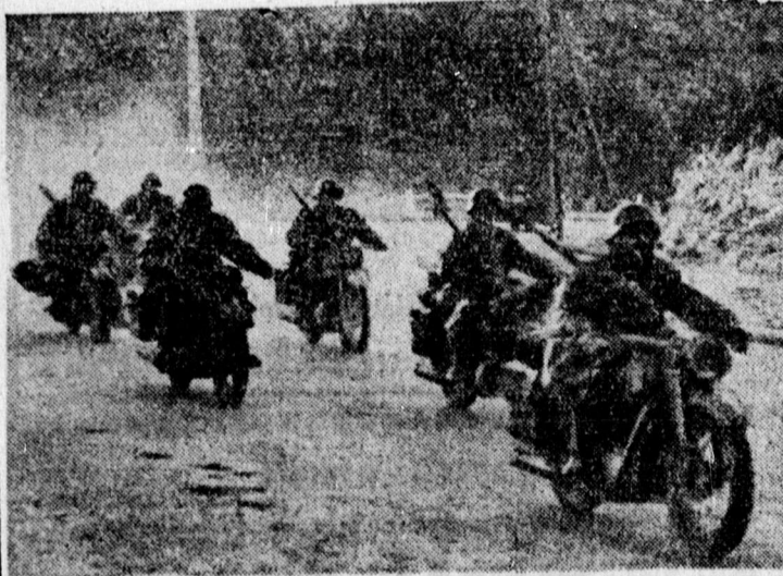
Német csapatok bevonulása a meg nem szállt francia területre

— A háborús karácsonyról, honvédeink Don-menti bravúrajairól, az afrikai és keleti hadszíntér helyzetéről közöl szemléltető, ritka érdekességű fényképfelvételeket, képsorozatot a Magyar Erő karácsonyi előtti száma. Eredeti kép és riport sorozatok számolnak be a nagyvilág és Magyarország elmúlt heti eseményeiről, kétoldal terjedelmű képsorozat ismerteti a távolkeleti helyzetet. A képeslap előállítási technikái szenciációja, hogy a Magyar Erő már most számol be a japán haderő új offenzívájáról India határai felé.