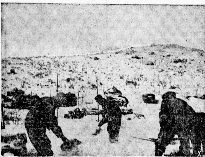
Német hegyivadászok tisztítják az utat a Murman-fronton az únpótlás zavartalanosságának biztosítására