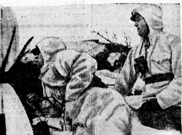
Német megfigyelők a Hajduföldön