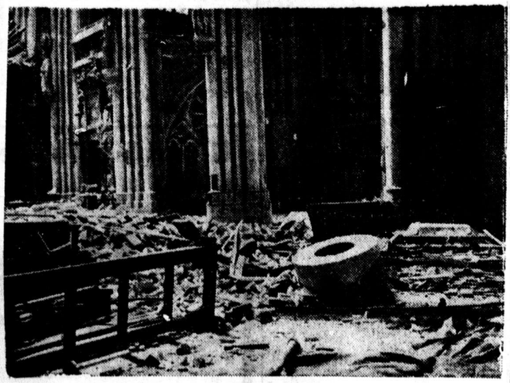
A kölni dóm egyik hajója a bombázás után