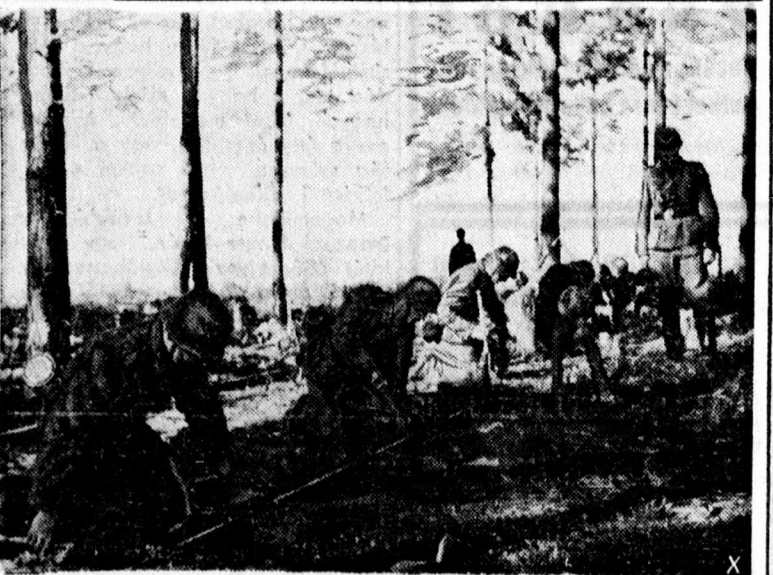
Német utászok utat építenek valahol Oroszországban