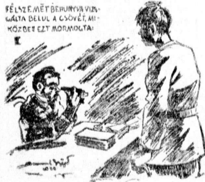
FÉLZEMÉNYT BEHUNYVA VIZSGÁLTA BELÜL A CSÖVÉT, MIKÖZBET EGY MORGOLTA!

— Ön ugyebár kérvényt nyújtott be, amelyben felvételeit kéri a kolhoszba? Bólintottam.