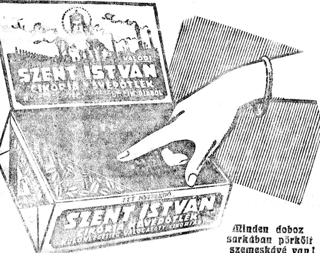
Minden doboz sarkában pörkölt szemeskávé van!