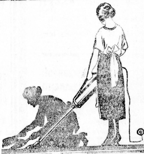
A TAKARÍTÁS EGYKOR ÉS MOST.

Fiókjaink: G. dr. Miskolc, Pécs, Szeged, Szombathely, Arad, Nagyvárad, Temesvár. — Kérje „D” jeitú prospektuunkat!