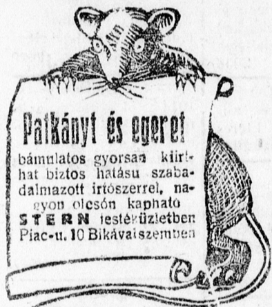
Ingyen utasítás mindenkinek. Saját érdekében győződjön meg.

Páratlan alkalmi vételek: kályhák, női és férfi télikabátok, cukrászdai és kávéházi berendezések, nagy tükrök, villanycsillárok, fából és bronzból, női és férfi varrógépek, mindenféle hajlított székek, egész és fél háló, ebédlőszekrények, konyhaberendezések, előszobafalak, állófogasok, diványok, hencserek, afrikai és lőszormatracok, magános ágyak, rézágak, gyermek-ágyak, betegtolókocsok, kanaláberek, művészi festmények, képek, virágállványok, szobrok, vázák igen nagy választékban és mindenféle ajándéktárgyak, debreceni és hortobágyi emléktárgyak: csikóbőrös kulacsok, fanyéros pipák, dohányzacskók, fokosok, eredeti hortobágyi pásztor karikások, néprajzi tárgyak és mindenféle ingóságok. Jól jegyezze meg: ha bármit venni vagy eladni akar, mindenképp jöjjön el az Ingóságközvetítőbe. Milliókat spórolhat meg és mindent egy helyen beszerezhet, ha itt vásárol.