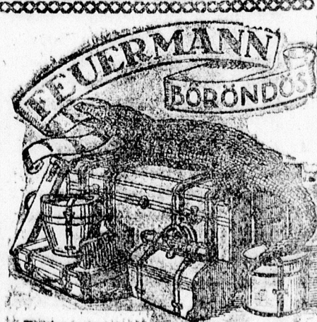
Böröndök, retikülök, pénztárcák Piac uccsa 26. (Passage).

Jegyek a Méliuszban és a városi zeneiskolában kaphatók.