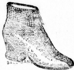
Ball-F and Indiana hőcipő

a kultur erőt, amelyet az ifjúságnak zenei nevelése jelent. A sajtó is a legmelegebb érdeklődéssel tekint kiváló Filharmónikusaink második hangversenye elé.