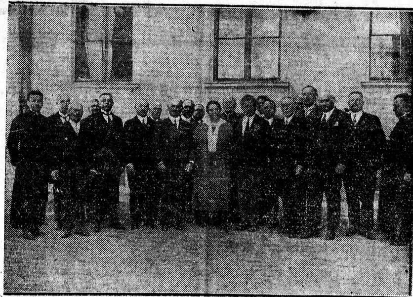
A debreceni tankerületi igazgatói értekezlet résztvevői.

Elnöklő főigazgató indítványá- ra az értekezlet egyhangú lelkesé- désel elhatározza, hogy közokta- tásügyünk vezérét, dr. Klebelsberg