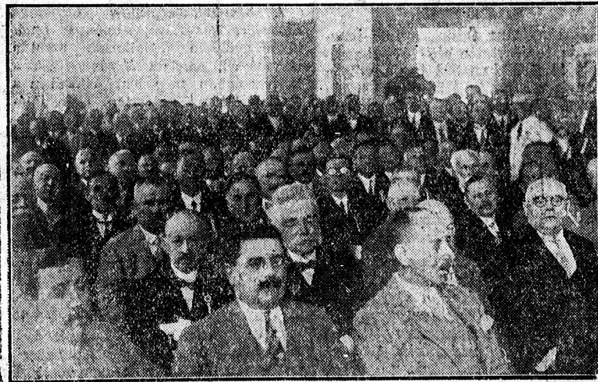
A Debreceni Egységes Pártkör közgyűléséről. (A zsúfolt terem közönségének egy része.)

De befogják látni, ha magyar szívükre hallgatnak, hogy az