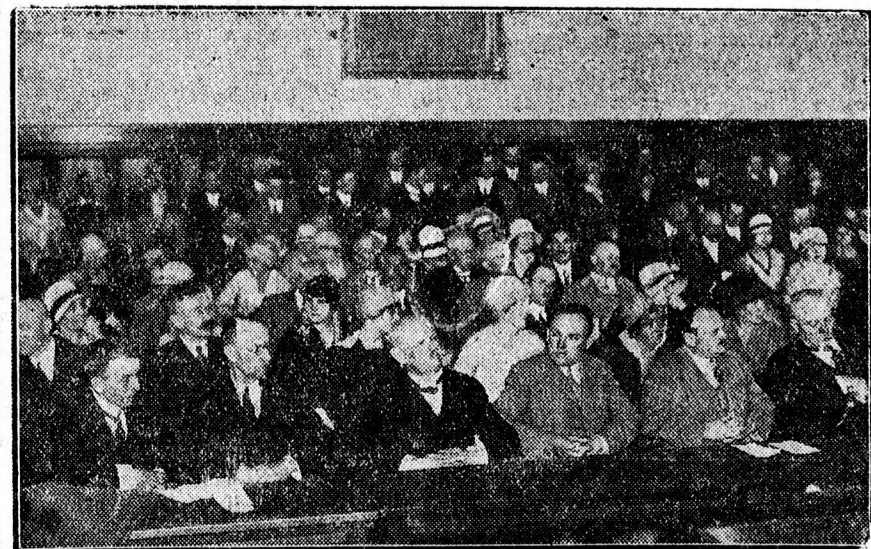
A Gönczy-Egyesület közgyűlése a Vármegyeházán.