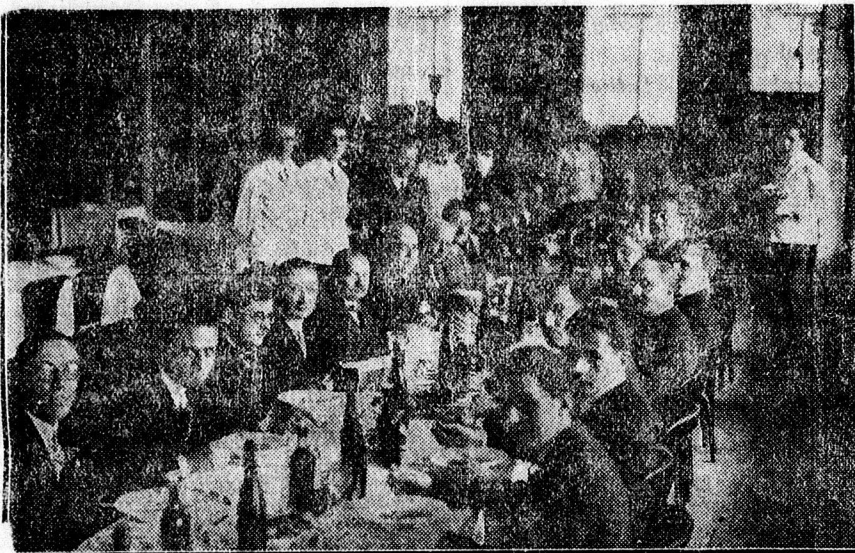
Az olasz vendégek bankettje a Bikában. (Olasz egyetemi tanárok debreceni kollégáik társaságában. — Az asztal végén olasz egyetemi hallgatók.)

Az olasz vendégek tiszteletére az egyetemi tanács hétfőn ebédet adott a Bika éttermében.