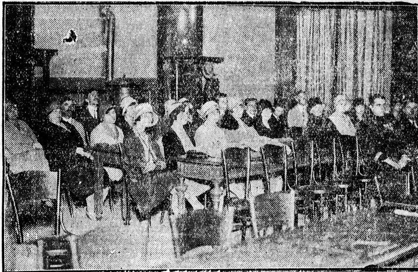
A közgyűlés közönségének egy része.