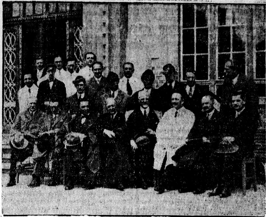
A milánói egyetem orvosprofesszorai debreceni kollégáik társaságában.

Fel a szívvel kis Pacsirta! Hadd szóljon a dal! Vár reád az új viadal, Ujabb diadal! Döngjön a föld lépted alatt, Házd ki jól magad! Ne feledd, hogy a Pacsirta Pacsirta marad!