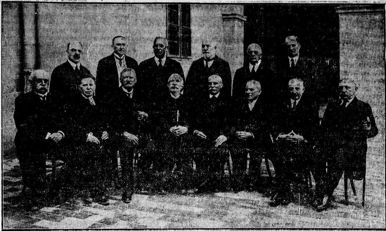
Csoportkép a kollégiumi diákszövetség összejöveteléről.

A „DEBRECZEN” szombat reggeli száma közli az egész heti teljes rádió-műsort.