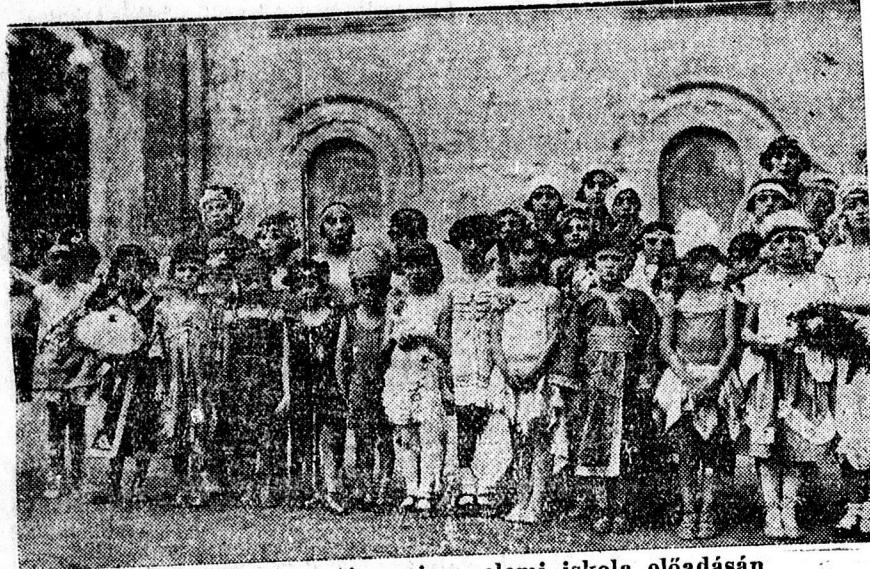
A tündérek csoportja az iz. elemi iskola előadásán.

x A Roykó-féle Tiszaujlaki ba-juszpedró mindenütt kapható.