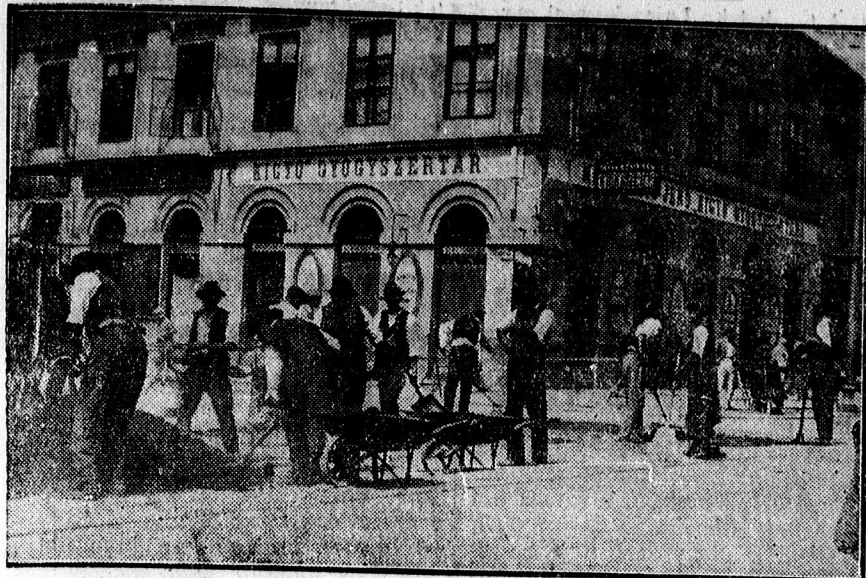
Aszfaltozási munka a Piac- és Szechenyi-utca sarkán. Teljesen renbehozzák a Piac-utca burkolatát a dalosverseny idejére.