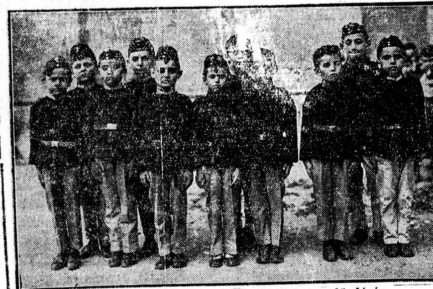
A katonák csoportja az izr. elemi iskola előadásán.