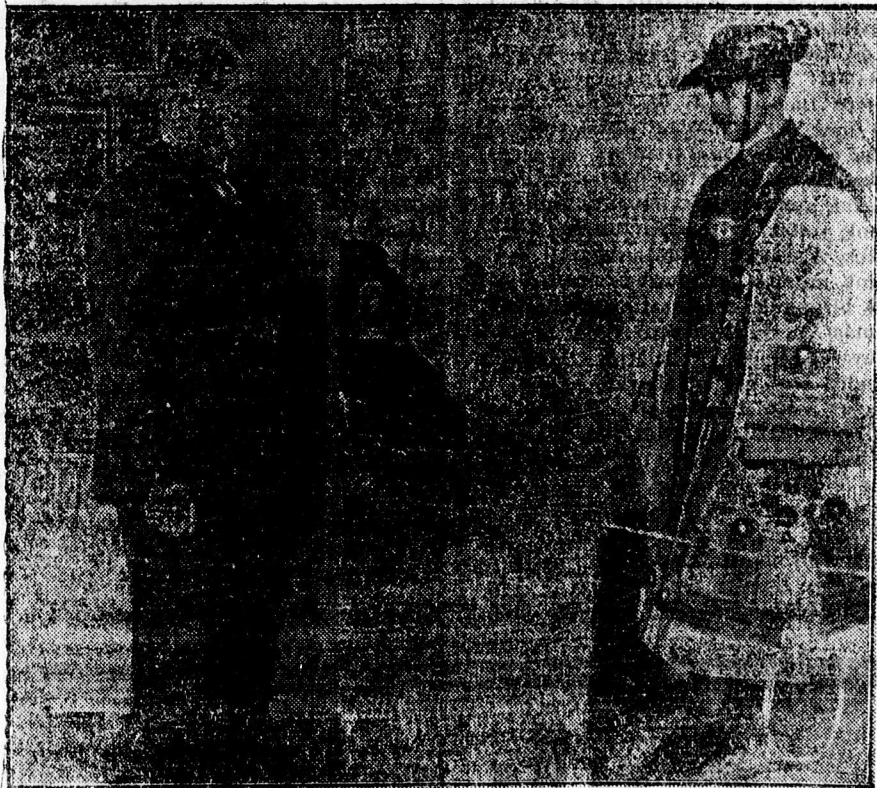
A különlegességi kiállításról. — A Déri muzeum kiállítása.