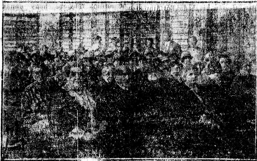
A Volt Iskolatársak Szövetsége közgyűlése a Dóczyban.

Valahogy mindig bizonyos keleti felvillanással állók meg a Pálffy mester képei előtt, mert a táguló, beláthatatlanul elcsúszó messzeségű perspektíván érzem a nagy pusztaságok keleti lehelését. Egy-egy kicsi képre már magában véve művészetet ilyen felülről prespektívát beleültetni. Óserő letagadhatatlan felvillanása az ezer éves multnak, mikor a magyar képzőlet keleti kedvvel száguldott a végelethatatlan pusztaságokon. Az egyhangú vidéknek ezer skálát zengő művészete ez. A síkságnak monumentálisan előretörő kiemelkedettsége. Idegen, más földről jött művész nem tudná se utánozni, se megtanulni, mert ez az, amivel együtt született a magyar művész, mint ahogy Pálffy mester is. Kiállítása méltán képviseli a debreceni pikúrát. — Sz. R. I.