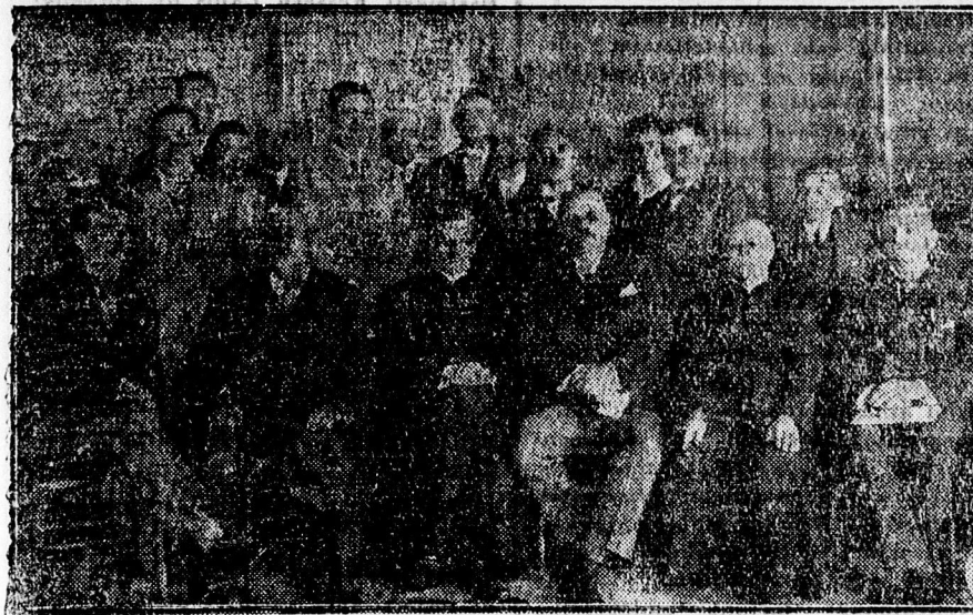
A' piarista Diákszövetség közgyűléséről.