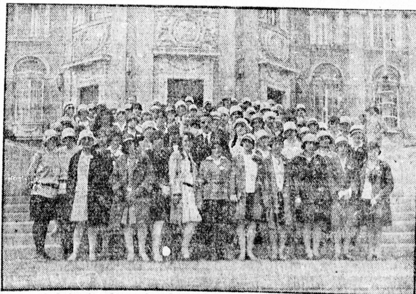
A leánykonferencia résztvevői a Déri Muzeum előtt.

A klinikák megtekintése után délután 5 órakor elutaztak az amerikai vendégek.