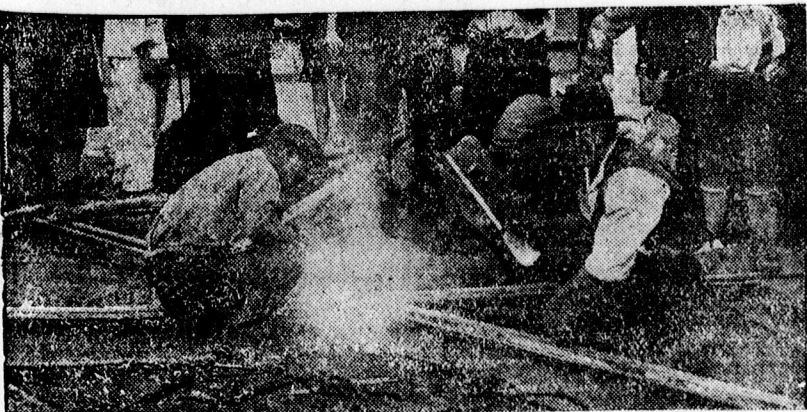
Villanyerővel végzett sínfórasztás a Piac-utcán.