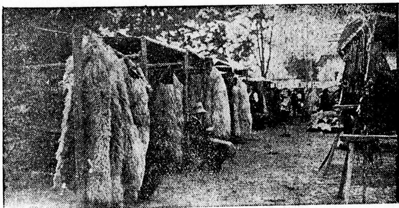
Nincs érdeklődés a gubásoknál.