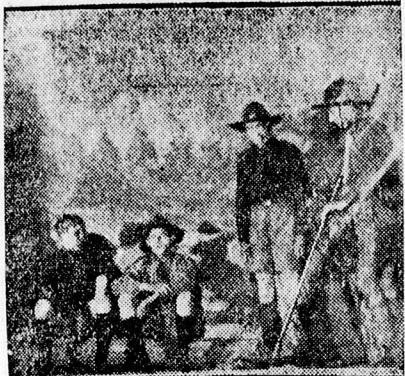
Jelenet a cserkészek által előadott színdarabról.

A jól összeválogatott műsor, amelyben a csapat több tagja és