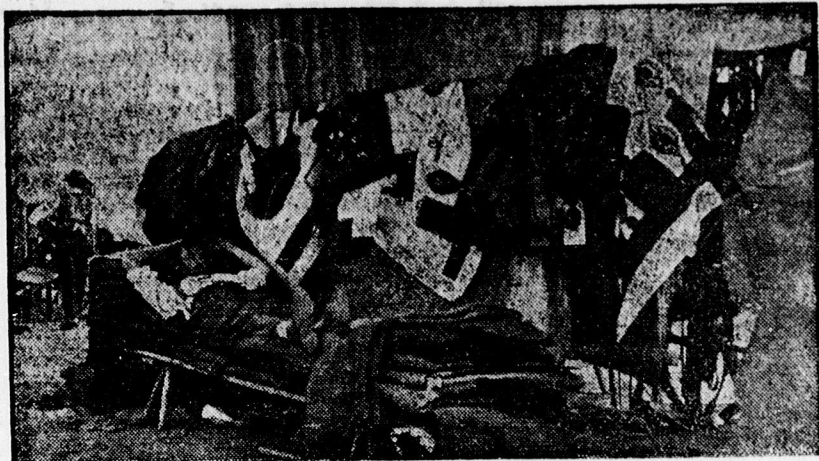
Akinek a „legjobb dolga“ volt a vásáron.