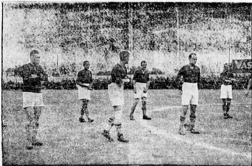
Pécs-Baranya feláll a kezdéshez.