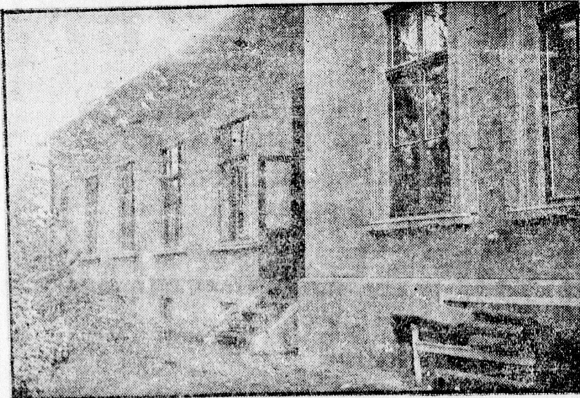
A járvány kórház épülete.