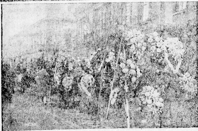
Koszorúvásár a virágpiacon.