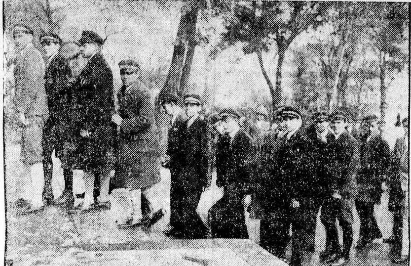
Isentiszteletre mennek a ref. tanítóképzősök.

művészettel a XIII. színt az „Em- ber tragédiájá'-ból. A szép és minden tekintetben művészi ünnepélyt a Gályarabok éneke fejezte be, mint a kollégiumi Kántus adott elő Szigethy Gyula dirigálása mellett.