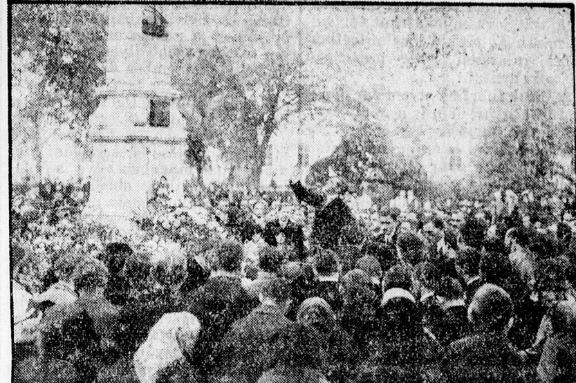
Ünnepi szavalat a gályarabok emlékoszlopánál.