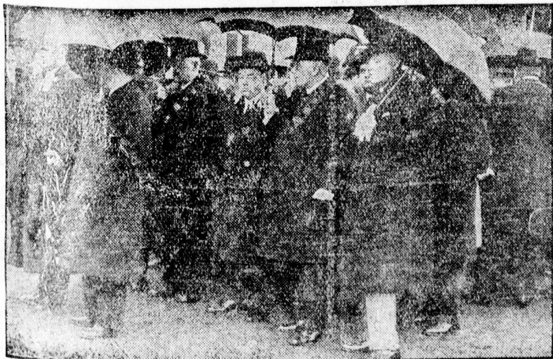
Az egyetemi tanács a gyászmenetben.

— Még egy esztendő sem perdült le az idő örökkévaló rohanásában, az első seb még be sem hegett, — már az isteni gondviselés kifürkész-hetetlen elhatározása új, mélyeséges gyászba borította nűsüges társai-dat. Megrendülten állunk ravatalod-nál, fennkölt lelkű Barátunk. Ez volt az első és egyetlen fájdalom, melyet Te valaha okoztál: Te, az odaadó, kifogyhatatlan Jóság esz-ményképe, ki végtelenül harmoni-ikus, hosszú életed folytán mindig csak könnyeket száritottál és fájdalmat enyhítettél. A leggyöngé-beket, a piciny, szenvedő gyermeke-