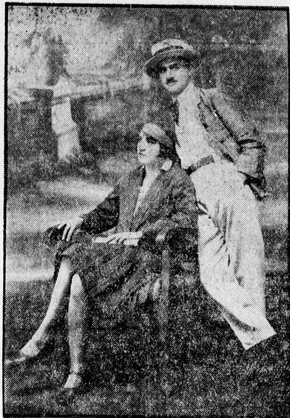
A török bey és felesége.

alatt óriási változások történtek. Régebben török nő nem lehetett színésznő, így a török színpadokon a női szerepeket örmények játszották.