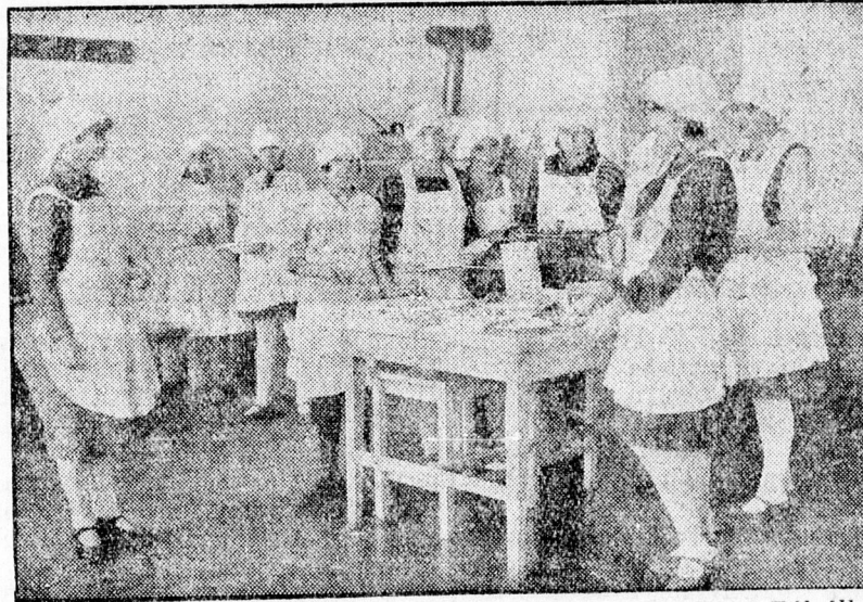
A II. számú gazdasági iskola főzőtanfolyama, amelyet Petri Pál államtitkár meglátogatott.