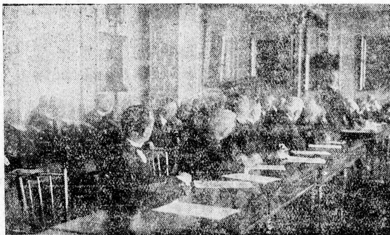
Az egyházkerületi közgyűlésről.

Abból az oláh vallásos iratból, a mit Bethlen Gábor szorgalmazására és intézkedésére adtak ki, jegecesedett ki az oláh nyelv. Ez történelmi igazság. Ez nem gyalázkodás és egyáltalában nem fenyegetés. Ez csak Bethlen Gábor végtelen nagyságát jellemzi és jellemzi a magyar felfogást a mult századokban, amely akkora türelmeséggel viseltetett az erdélyi három nemzetből (magyar, székely, szász) a szással és az akkor még nemzetként nem is szereplő oláhsággal szemben. Az én beszédemből még a legnagyobb rosszakarral sem lehet kiolvasni azt — mintha az gyalázkodás vagy fenyegetés volna.