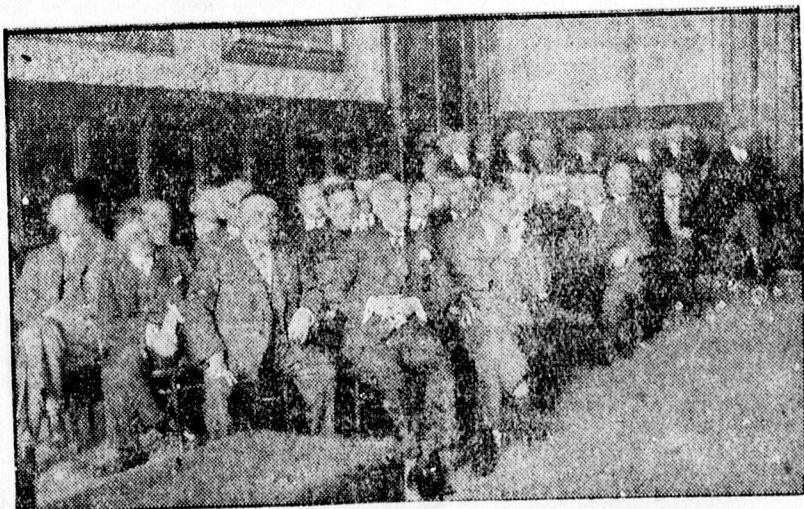
Hajduvármegye új törvényhatóságának alakuló közgyűléséről

A javaslatot egyhangulag elfogadták, ezzel Hajduvármegye ünnepélyes alakuló közgyűlése véget ért.