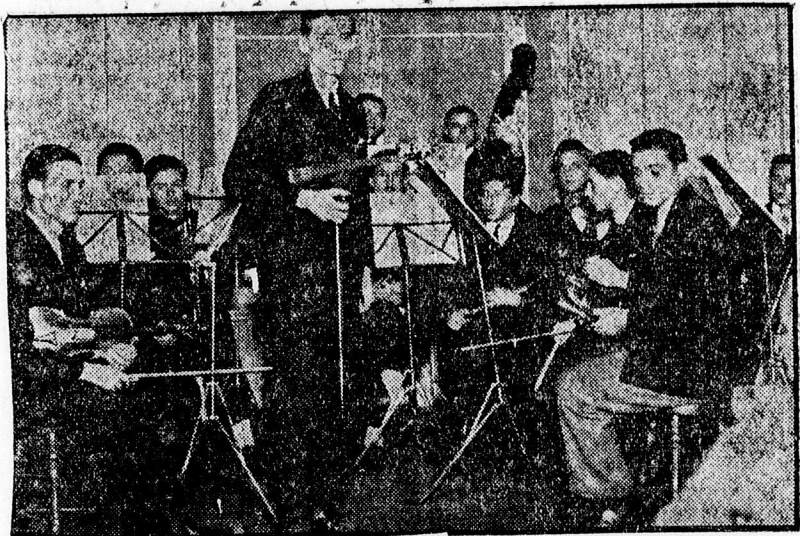
A ref. tanítónőképző zenekara, mely az estélyen szerepelt.