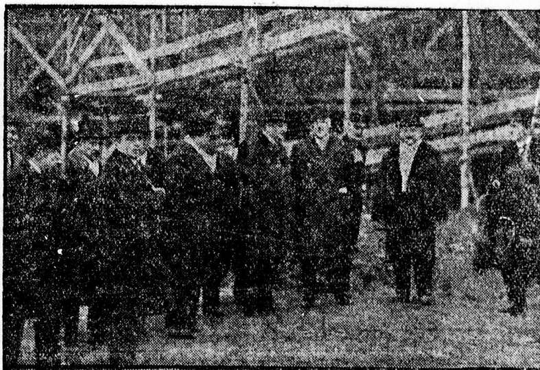
Az olasz és magyar kultuszminiszter az egyetemi központi épületnél