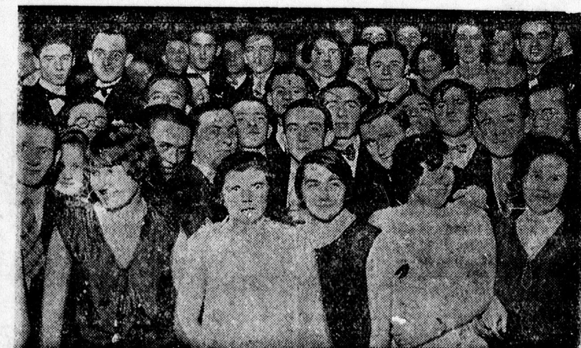
A csizmadia hál közönségének egy része.