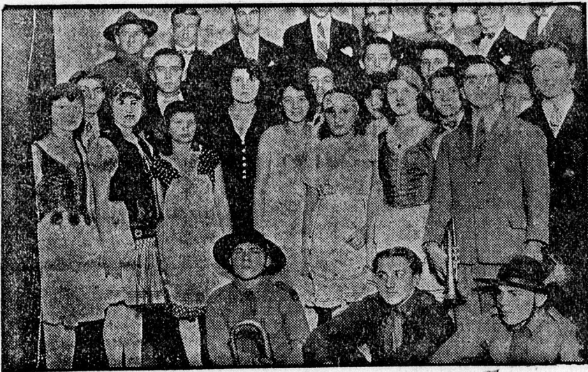
Az iparos leventék műsoros délutánjának szereplői.

A „DEBRECZEN“ szombat reggeli száma közli az egész heti teljes rádió-műsort.