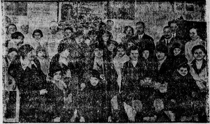
A mikeszécsi áll. elemi iskola karácsonyi ünnepén sok szegény sorsu tanuló ajándékot kapott.