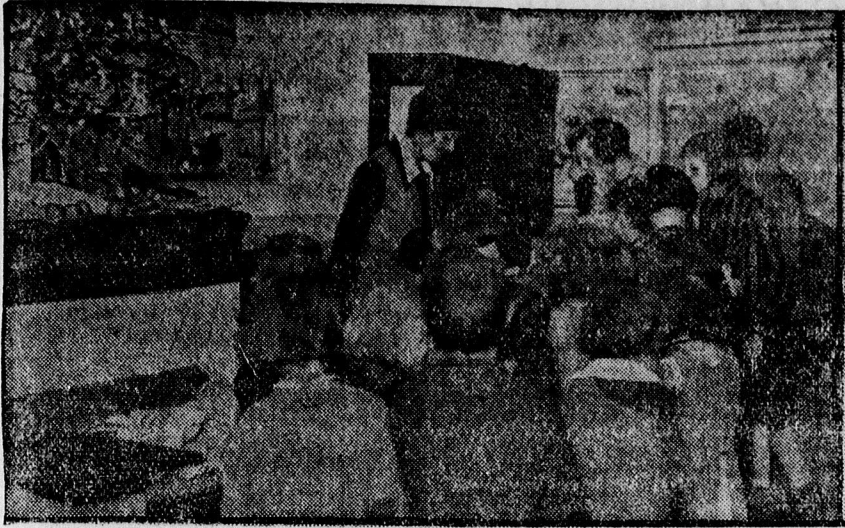
Kiosztják az ajándékokat a gyermekeknek.