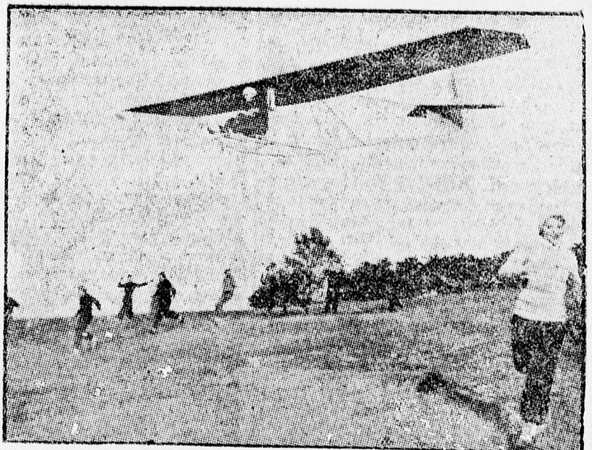
Külföldön a motornélküli repülés egyike a legkedvesebb sportoknak, már a nők is kultiválják.