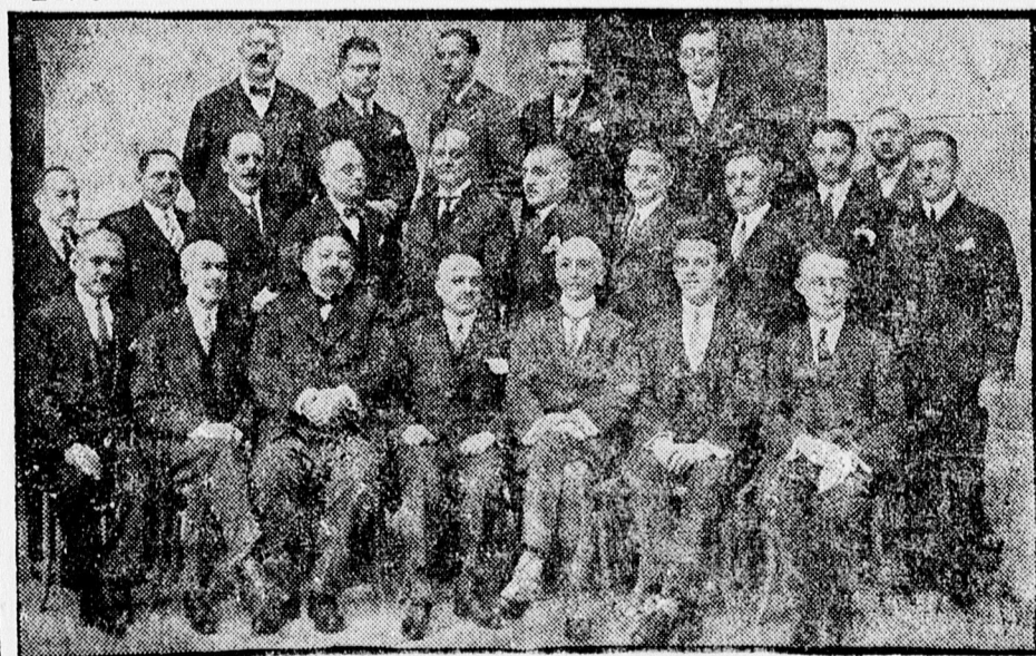
A járásbíróóság bírói és jegyzői kara.

Ugyanott Diathermia, iszap, villany és szénsav kezelések.