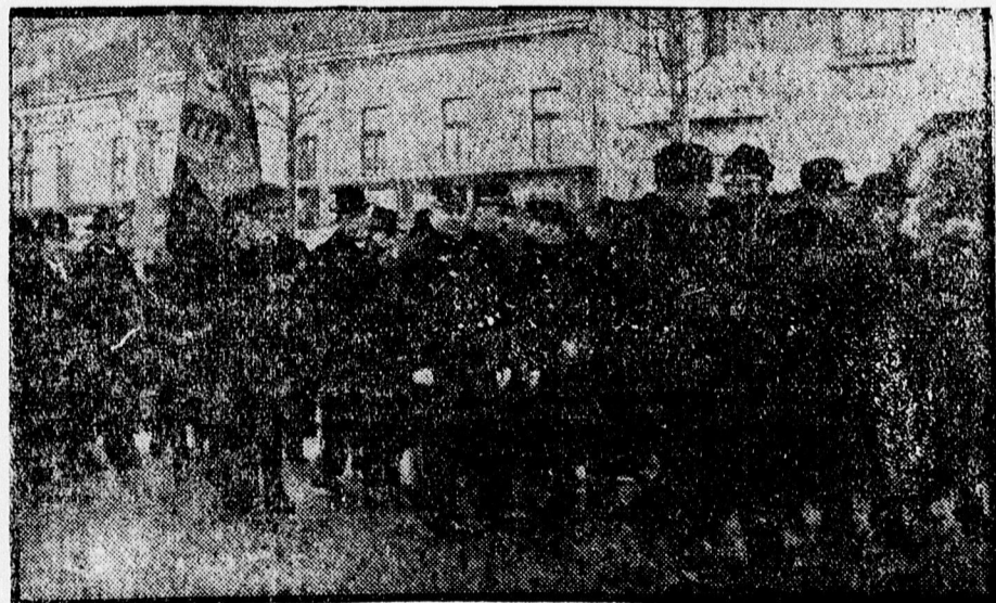
A gyászoló menet.