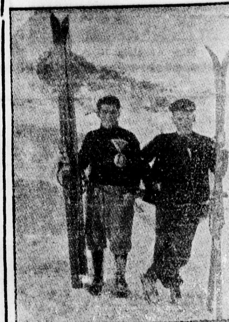
Világrekord a sífutásban. Két osztrák versenyző a St. Moritz-versenyeken eddig még meg sem közelített eredményt értek el. Egy óra alatt 105 és fél km. útat futottak be sível.

Magában Hamburgban az éjszaka aránylag nyugodtan telt el, csak a Sagedild vendéglő körül, mely a kommunisták gyülekező helye, voltak kisebb surlódások, amelyekben azonban a rendőrség maradt felül.