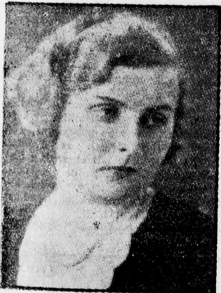
Miss Ausztria 1930.

Ma délután az ügyészség intézkedett a főkapitányságon, hogy állíttassák elő a Rimini kávéház tulajdonosát. Az előállítás a déli órákban megis történt, Kardost átvitték az ügyészségre és ott letartóztatták.