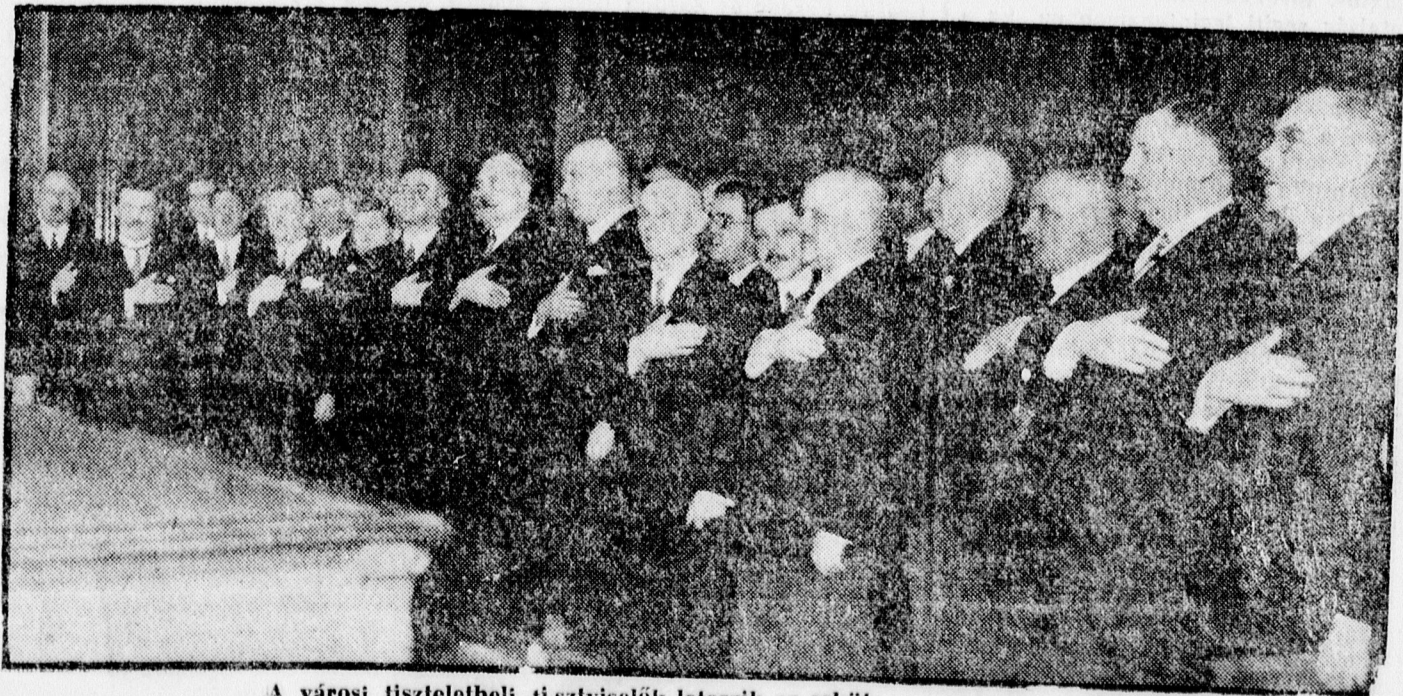
A városi tiszteletbeli tisztviselők leteszik az esküt.

A választmányba 25 tagot választottak titkos szavazással. A tisztújító közgyűlésen a központ is képviseltette magát.