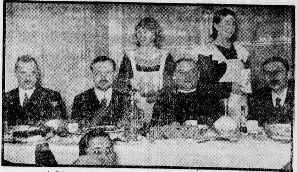
A Péterfia utcai ref. egyházzrész szeretetvendégsége.

A tea-estély résztvevői kellemes hangulatban töltötték el néhány óráját.