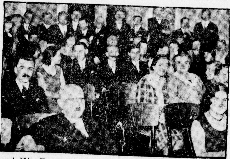
A Máv. Egyetértés Dalkörének hangversenye a Zenedében.