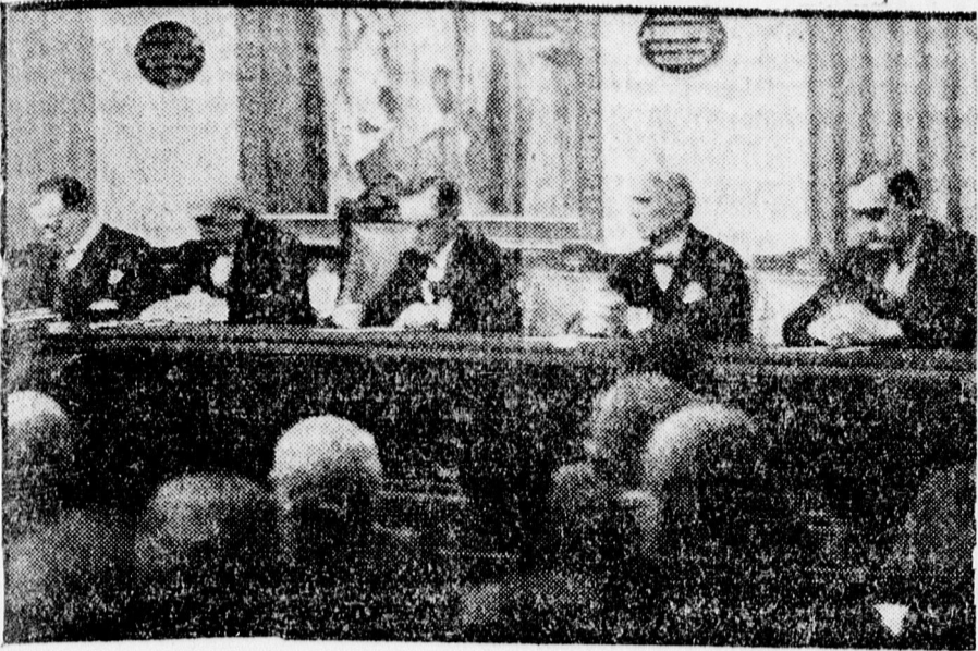
A kereskedelmi és iparkamara diszüléséről.