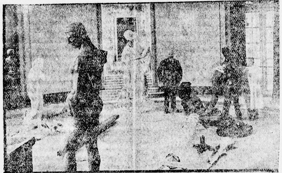
Szobrok a Déri muzeumban, amelyeket most rendeznek el.

Soltész, Püspöki pa'ola, II. kapu 25. Telefon 12-59.