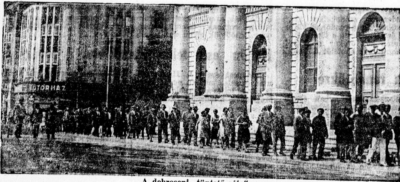
A debreceni „tüntető séta“.

izr. családnál teljes ellátást kaphat, esetleg lakás nélkül is. E deklódni: Fülöp, Csapó-u. 3. sz. Ugyanott fizletberendezés eladó.