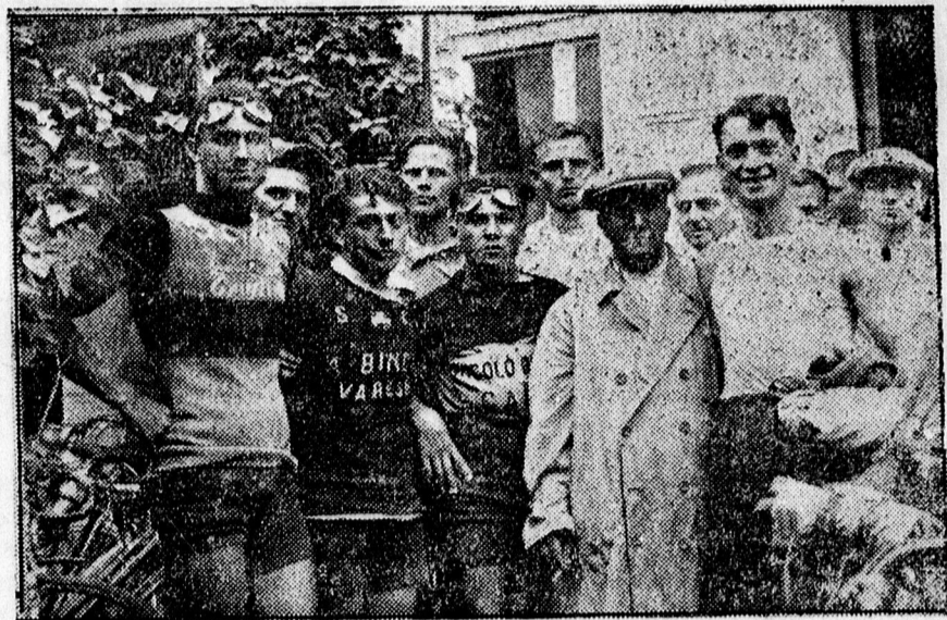
Az olasz versenyzők csoportja.

lepihentek. A színes dresszes kerékpárosok természetesen nagy fel-tűnést keltettek Debrecen utcáin. — Debrecenből pénteken reggel 6 órakor indulnak tovább a versenyzők a második szakasz abszolválására, a trianoni határ mentén