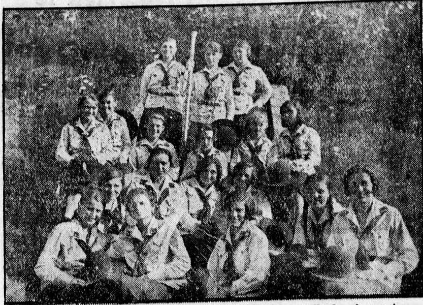
„Bethlen Kata” leányserkészesapat táborozása Bodrogkeresztúron.

X Tankönyv-vásár! Tankönyvesere. Használt tankönyv félárban. Böhm Ferenc könyvkereskedésében, Ferenc József út 7. szám. (Bika-szálló melletti)