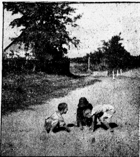
Művészi fénykép a z utagyerekekről.