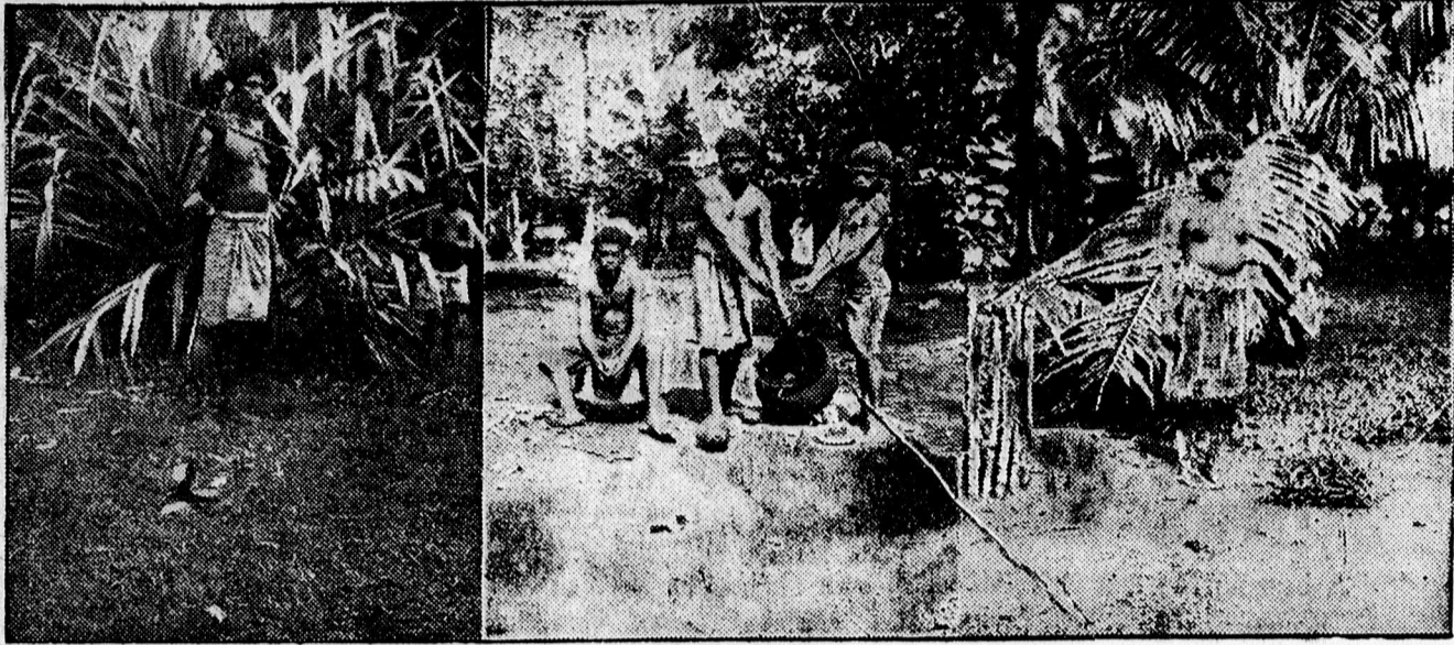
Harcos teljes fegyverzetben.