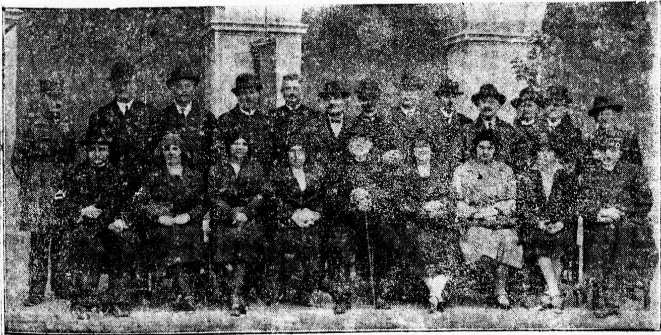
Akik 20 éve végeztek el a theologiat a kollégiumban.