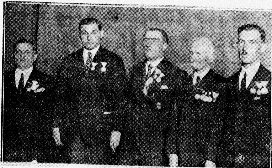
A jubiláló böszörményi „Törökves” dalkör diszközgyűlésének elnöksége.