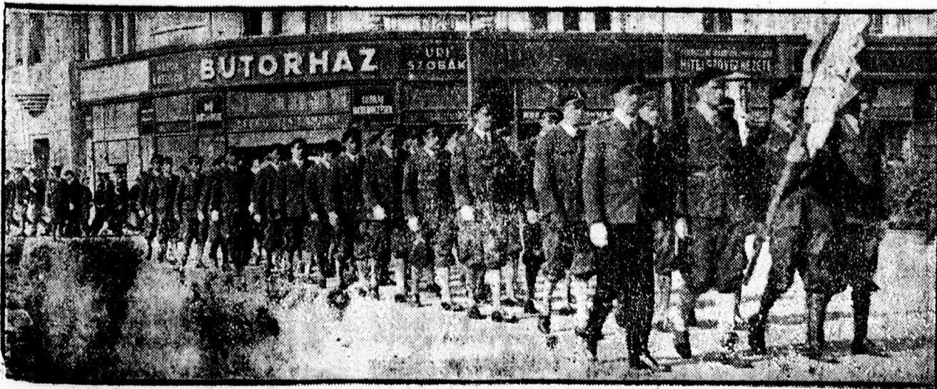
A bajtársi dísz-csapat felvonulása az egyetlen meggyítő ünnepélyre.

X Olesó kiadásban jelent meg a „Katonadolog” című lebilincselően érdekes háborús regény. A 160 oldalas kötet ára 80 fillér. Kapható a könyvkereskedésekben és a trafikokban.