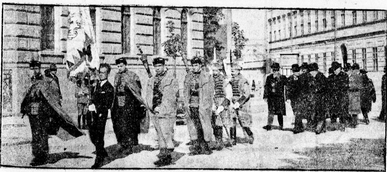
Tógátus diákok a menet élén utánuk az egyetemi tanács.

sen díszítették fel. Az egyetemi ifjúság pedig fegyvelmezett, katonás rendben vonult bajtársi jelvényeivel az ünnepélyre.