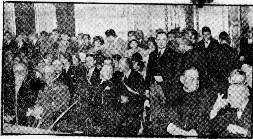
Az előkelő közönség egy része az ünnepélyen.