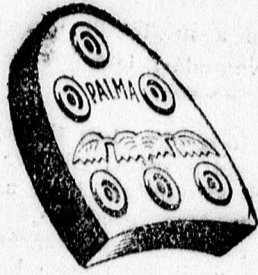
Egészség, kényelem, lakérfkösség megköveteli a PALMA KAUCSUK-SARKOT.

Csak nyugalom! Uralkodjon az idegeim! Türelem — rummyt terem!